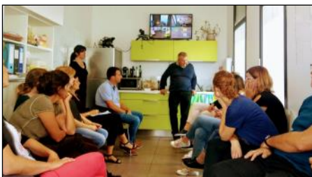
L'équipe de la MSPU

Les problèmes liés à la démographie médicale ont considérablement modifié l'organisation des soins dans les territoires et favorisé l'écllosion de nouvelles structures de soin comme les MSP. La finalité de ce type de structure est d'intégrer autour d'un projet de soin partagé, les notions de coordination des soins, partage de données, inter professionnalité et solidarité afin de garantir l'accès au soin et l'amélioration de la santé pour tous.