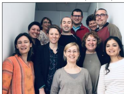
L'équipe de l'URN

Responsable scientifique de l'Unité de Recherche et de Neurostimulation (U.R.N.) Centre Hospitalier Esquirol - Limoges